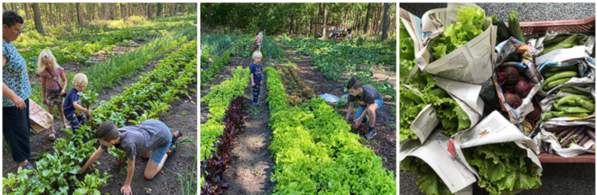
Oogsten groenten met de kids (sla, biet, peultjes) om weg te geven - juni 2023

De motivatie ook mee te doen is divers: het sociaal aspect, kennis en ervaring delen, kinderen erbij betrekken, uitdelen aan minder bedeelden en zelf biologische groente telen en eten.